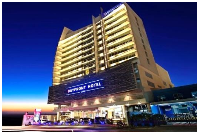
宿霧海灣飯店 Bayfront Hotel Cebu

酒店設有室外游泳池。客人可以在內部餐廳用餐，或在酒吧享用飲品。所有客房均提供免費 WI-FI。