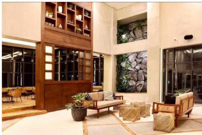
宿霧馬約酒店 Maayo Hotel Cebu