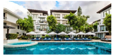
發現海岸度假村 Discovery Shores Boracay