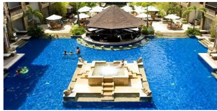
漢娜系列：Henann 麗晶 瀉湖、花園、尊貴、水晶