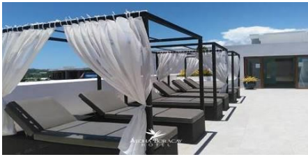
阿羅哈度假村 Aloha Boracay