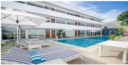
海岸度假村 Coast Boracay