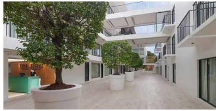
海潮時尚度假村 The Tides Hotel