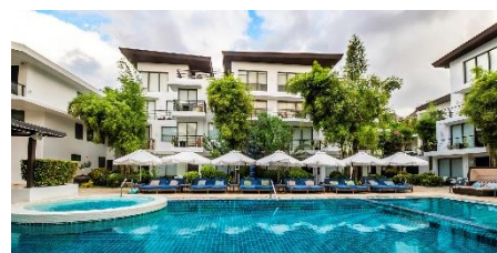
發現海岸度假村 Discovery Shores Boracay