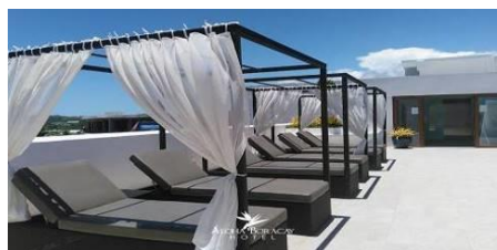
阿羅哈度假村 Aloha Boracay