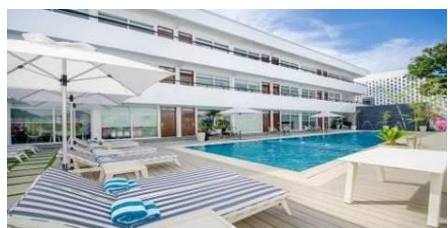
海岸度假村 Coast Boracay