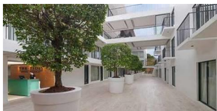
海潮時尚度假村 The Tides Hotel