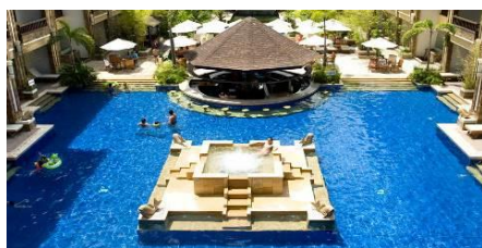
漢娜系列：Henann 麗晶 瀉湖、花園、尊貴、水晶