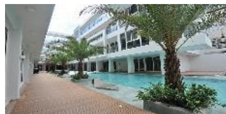
可倫特度假飯店 Astoria Current