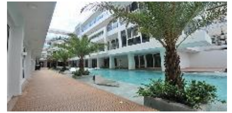
可倫特度假飯店 Astoria Current