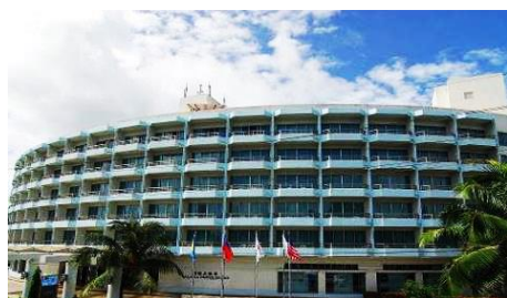
帛琉大飯店 Palasia Hotel

位於市中心，方便省時。七層樓高的現代式建築，呈現出帛琉最大和擁有最多客房的飯店，還擁有帛琉唯一桑拿和蒸氣房設備。