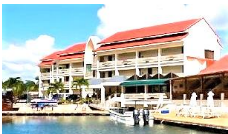
月伴灣度假村 Landmark Marina

有專屬碼頭。在探尋深藍色海底世界與色彩繽紛的熱帶魚群後，可以更悠閒的漫步走向房間，不須舟車勞頓往返兩地。