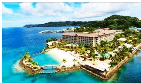
老爺酒店 Palau Royal Resort

飯店臨海，是帛琉最好的飯店之一。設計以度假飯店為構想，擁有SPA芳療室、碼頭、沙灘、海邊酒吧等設施。