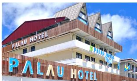
帛琉飯店 Palau Hotel

位於市中心最佳地理位置之一與WCTC購物中心僅需一分鐘的步程；館內客房均設有空調，公共區域可使用免費WI-FI。