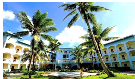
愛來度假會館 Airai Water Paradise

位於大島，恬靜優雅地座落在茂密的林蔭裡，其寬敞的空間設計，讓您感到心曠神怡，愉快無比，周圍是最大的紅樹林。