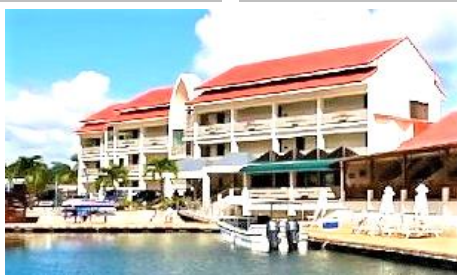
月伴灣度假村 Landmark Marina

有專屬碼頭。在探尋深藍色海底世界與色彩繽紛的熱帶魚群後，可以更悠閒的漫步走向房間，不須舟車勞頓往返兩地。