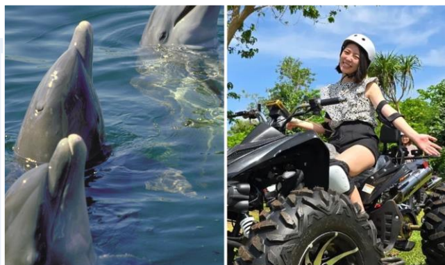
海豚遊蹤 & ATV 叢林探險