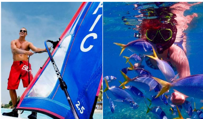
PIC風帆體驗 VS 魚眼生態公園