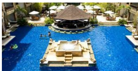
漢娜系列：Henann 麗晶 潟湖、花園、尊貴、水晶