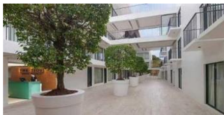
海潮時尚度假村 The Tides Hotel