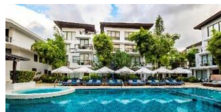
發現海岸度假村 Discovery Shores Boracay