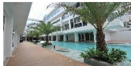
可倫特度假飯店 Astoria Current