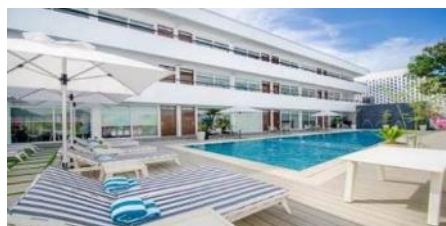
海岸度假村 Coast Boracay