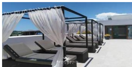
阿羅哈度假村 Aloha Boracay