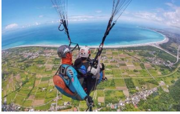
體驗飛行傘 | 翱翔太魯閣天際