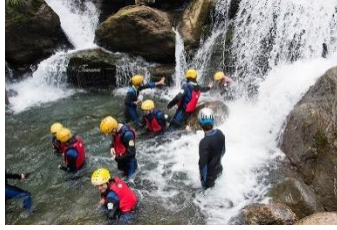
溯溪冒險 | 三棧南溪半日遊