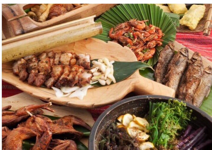
圖 / 巴奇克竹坊 (午餐)