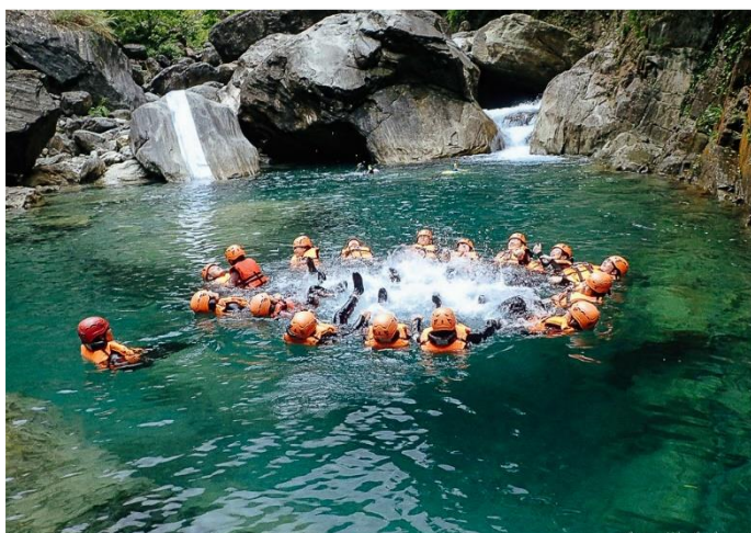
圖 / 三棧南溪溯溪

盡情體驗花蓮秘境溯溪，烈陽炙熱，河水冰涼，跳進天然深潭最是舒爽，真正精彩的是往溪水源頭溯行，越往峽谷內越是密林絕境，才能體會太魯閣原始獵人傳說的「踩著祖先的路徑，回到彩虹家園！」