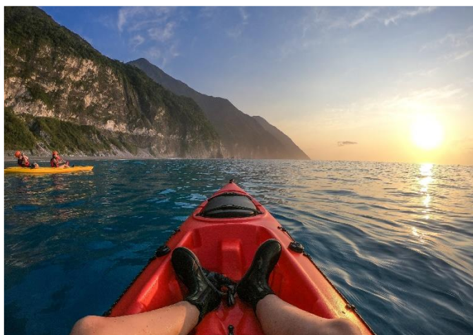
圖 / 海上獨木舟

知名景點清水斷崖，如果你只坐車到景點打個卡、看著高聳斷崖和太平洋上漸層藍的海水，那你只玩了一半，真正精彩的是划行在太平洋上，回望著清水斷崖，才能一眼盡現荷蘭人所說的「啊！這裡就是福爾摩沙！」