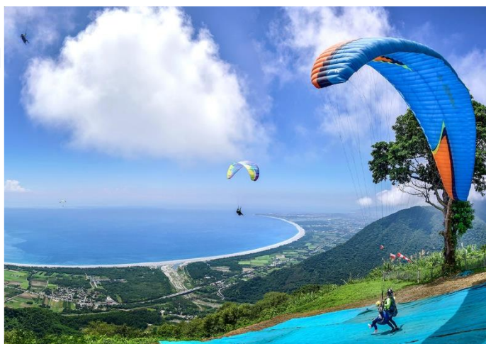
圖 / 飛行傘

起飛場位在太魯閣國家公園天際線、遠眺熠熠生輝的太平洋蔚藍海景、七星潭浪漫的月牙灣、名聞遐邇蒼翠陡直的清水斷崖景致、依山傍海壯麗山觀水色、令人忘憂大自然的鬼斧神工三棧溪谷，寶島極致炫！