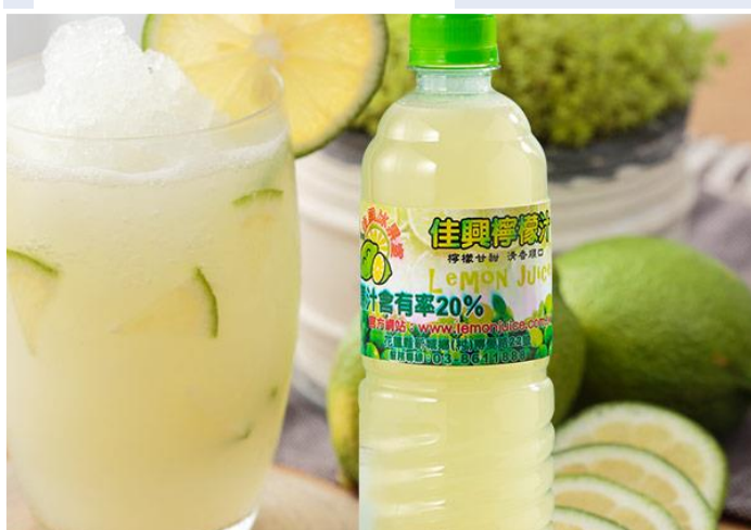
圖 / 佳興檸檬汁