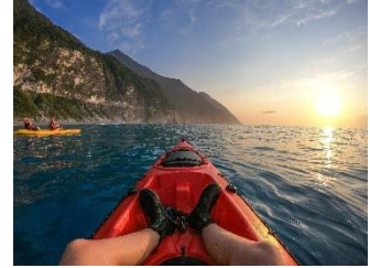
清水斷崖 | 海上獨木舟