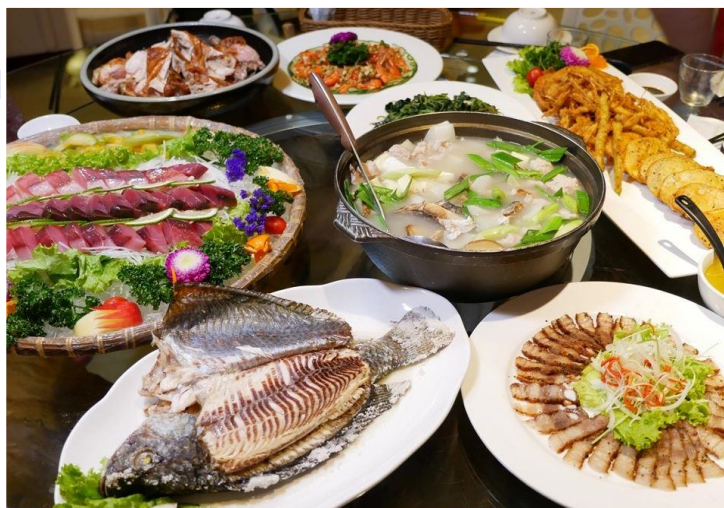
圖 / 太平洋食府 (午餐)

聘請五星級專業主廚團隊為客戶打造精緻餐點及在地美食。食物烹煮採用 [ 花蓮無毒有機農業生產 ] 的農產品以及太平洋特色海鮮烹煮。