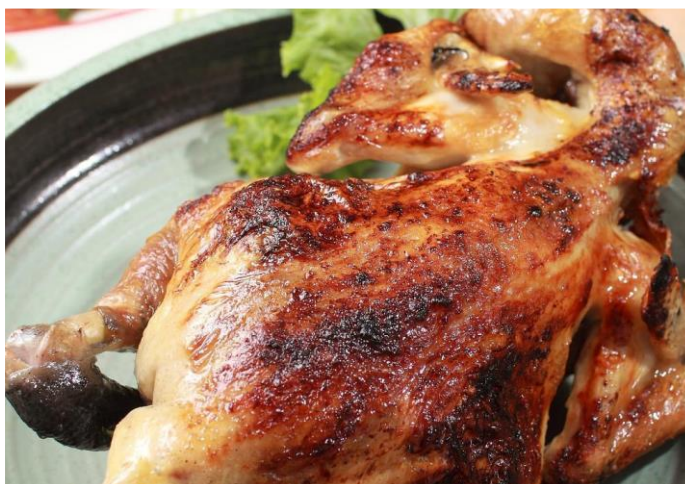
圖 / 洋基牧場招牌桶仔雞 (晚餐)

在地人激推NO.1風味餐料理！在洋基牧場可品嚐到獨家特製烤雞、香噴噴的烤魚，還有在地風味餐及原民風味料理等不同餐點。