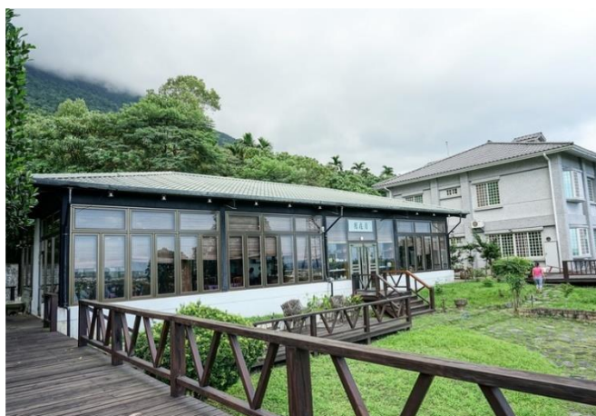
圖 / 自在園招牌菜 (午餐)